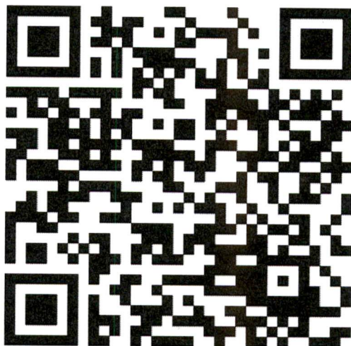
QR Code สำหรับเข้าสู่เว็บไซต์จัดส่งข้อมูล

หมายเหตุ ให้สำนักงานเขตพื้นที่การศึกษาจัดทำแผนที่แยกเป็นรายโรงเรียนตามประกาศ “๑ อำเภอ ๑ โรงเรียนคุณภาพ” โดยใช้รูปแบบ template ตามตัวอย่าง สามารถปรับเปลี่ยนสัญลักษณ์ องค์ประกอบต่าง ๆ ได้ตามความเหมาะสมของบริบทพื้นที่