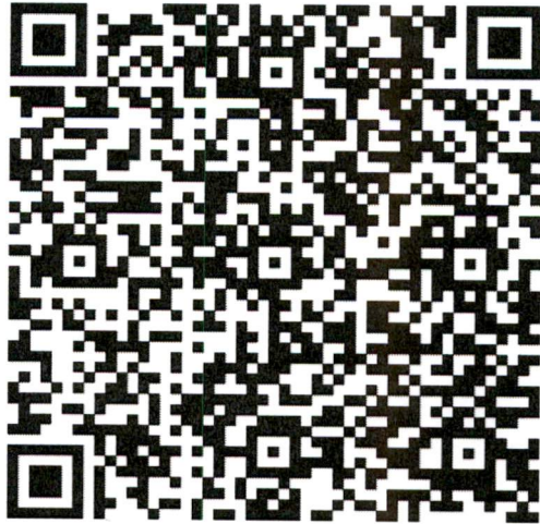
QR Code ดาวนโหลดไฟล์แผนที่

หมายเหตุ ให้สำนักงานเขตพื้นที่การศึกษาจัดทำแผนที่แยกเป็นรายโรงเรียนตามประกาศ “๑ อำเภอ ๑ โรงเรียนคุณภาพ” โดยใช้รูปแบบ template ตามตัวอย่าง สามารถปรับเปลี่ยนสัญลักษณ์ องค์ประกอบต่าง ๆ ได้ตามความเหมาะสมของบริบทพื้นที่